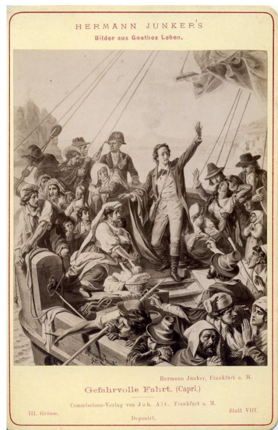
Abb. 2. Gefahrvolle Fahrt (Goethe vor Capri), gezeichnet von Hermann Junker, um 1875. Tafel aus dem zitierten Mappenwerk.

Von Sicilien kommend fuhr Goethe auf einem französischem Kauffahrteischiffe mit einer Menge anderer Passagiere wieder zurück nach Neapel. Der Schiffshauptmann war des Fahrwassers nicht ganz kundig und gerieth unterwegs in die gefährliche Strömung der Insel Capri. Die Lebensgefahr vor Augen, brach unter den Passagieren eine Emeute los. Man wollte dem Capitain an's Leben. Goethe, dem Anarchie