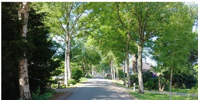
Abb. 4. Die Westerweder Allee im Mai 2018.

Im Frühjahr 1903 erschien Rainer Maria Rilkes Worpswede-Schrift, die er „im Frühling 1902“ 12 im nahe gelegenen Westerwede, wohin er gleich nach seiner Verheiratung mit Clara Westhoff verzogen war, geschrieben hat. Gegenstand von Text und Abbildungen