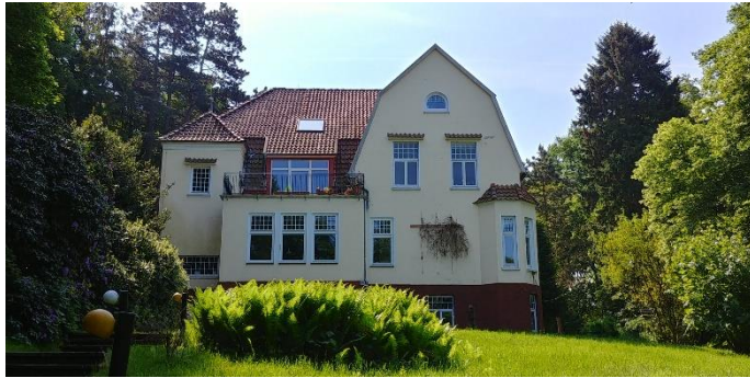
Abb. 3. Fritz Mackensens Villa im Mai 2018.

Älter und erfolgreich geworden, kam es 1899 zum Bruch, den Otto Modersohn zwei Jahre vorher vorausgeahnt hatte. Die deutschnational-politisierende Haltung Hans am Endes und Fritz Mackensens gab den Ausschlag, dass Otto Modersohn, Fritz Overbeck und Heinrich Vogeler ihre Mitgliedschaft im „Künstler-Verein Worpswede“ aufkündigten. Der gemeinschaftliche Schaffensgeist war somit hinfällig geworden. Die Zukunft gehörte fortan der Vereinzelung der Individuen.